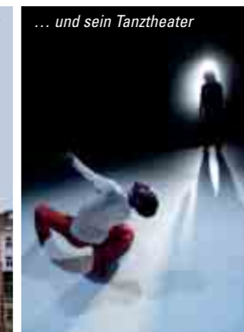
... und sein Tanztheater