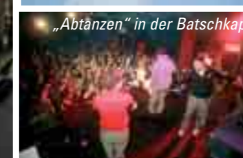
„Abtänzen“ in der Batschkapp